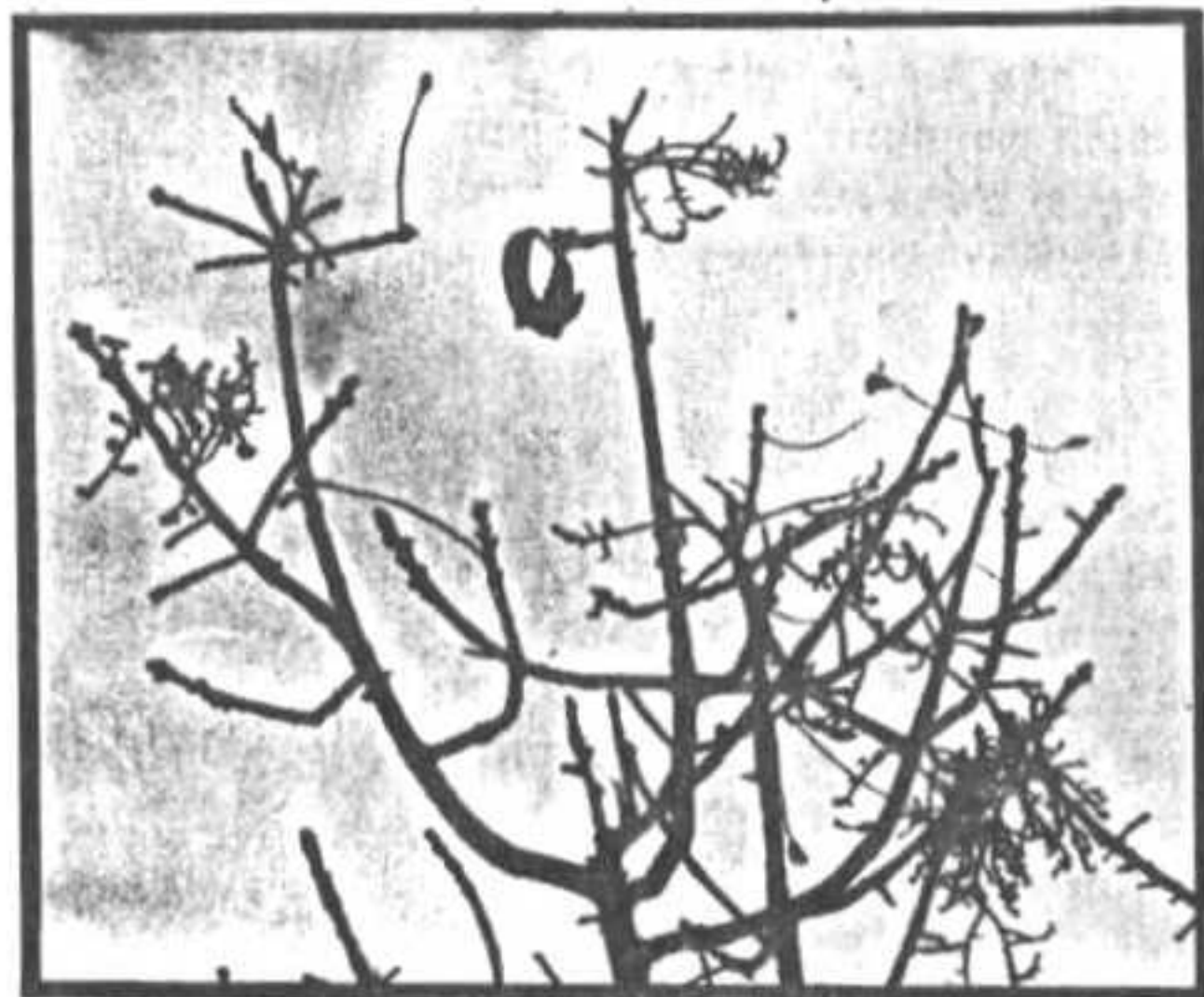
אלה ארצישראלית בשלכת העפצים דמויי תרמילים מוארכים

בין העצים נמנה את הקטלב המצוי הגדל ביהודה ככרמל ובגליל; העוזר האדום הגדל בגליל העליון בסביבות הר מירון; עוזר חדר גלעני המצוי ביער אודם ליד מסעדה והזית שהוא במקורו עץ בר בחורש שלנו. בין שיחי החורש יזכרו אשחר ארצישראלי; ברזית בינוני ואלת המסטיק.