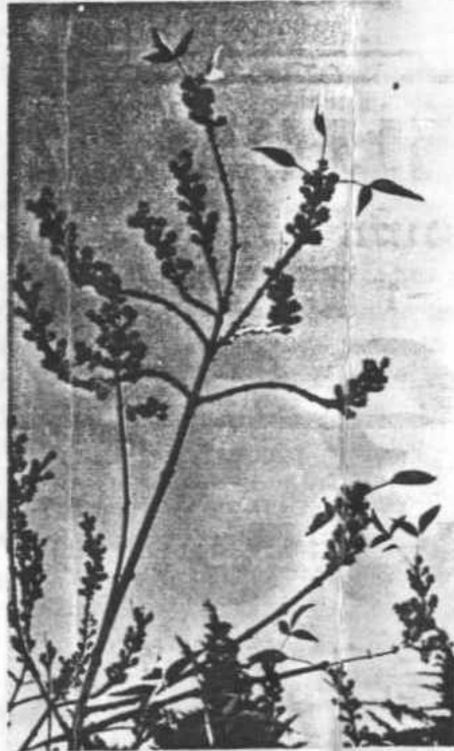
מילה בשלכת ובלבלוב