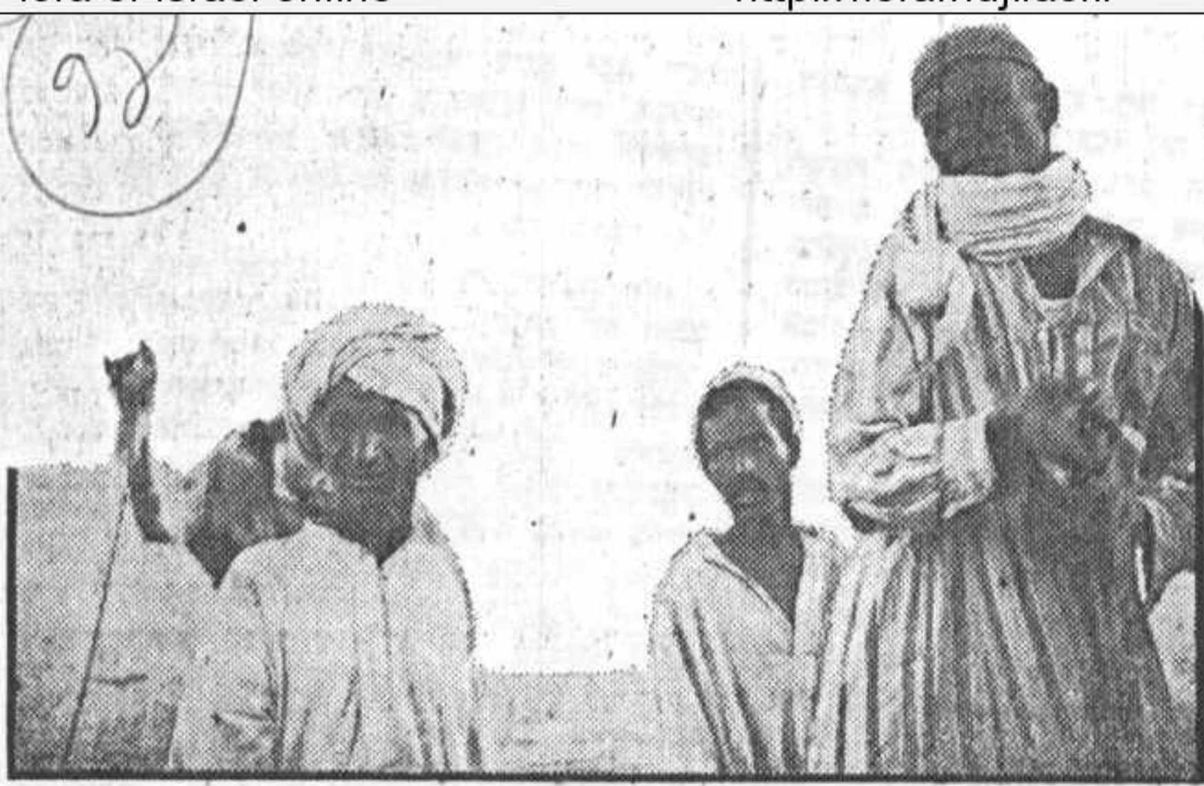
איך ידעו הבדווים להופיע עם גמליהם בדיוק בזמן ובדיוק במקום... שהוסכם עליו?

הנאקה שלו ובזרזם את הגמלים לפרוע ברכ לקראת העמסת הציד היית יכול לשמוע טון של בקשה או חתנצלות על שהוא מטריח את הגמל ממנוחתו. הגמלים עמוסים בציד כבד, גבות ה- חוקרים עמוסים בתרמילים, והמכוניות שבות אל הקטע בנחל בו נפגוש אותן בעוד שלושה ימים. ג'בל בידא נמצא ממזרח לפרשת המים של דרום סיני ושייך לתחום שחון, בו מעטים הגשמים. אולם הרום שלו — 1755 מ' — נסך בנו תקווה כי נמצא בו צמחיה של ממש. ככל שההרים גבו- הים הם גורמים לעננים מרובים יותר