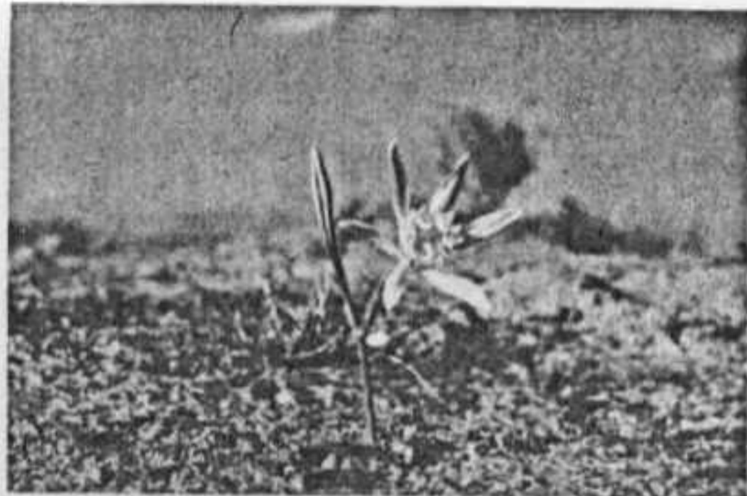
חבצלת קטנת-פרחים בחולות הנגב.