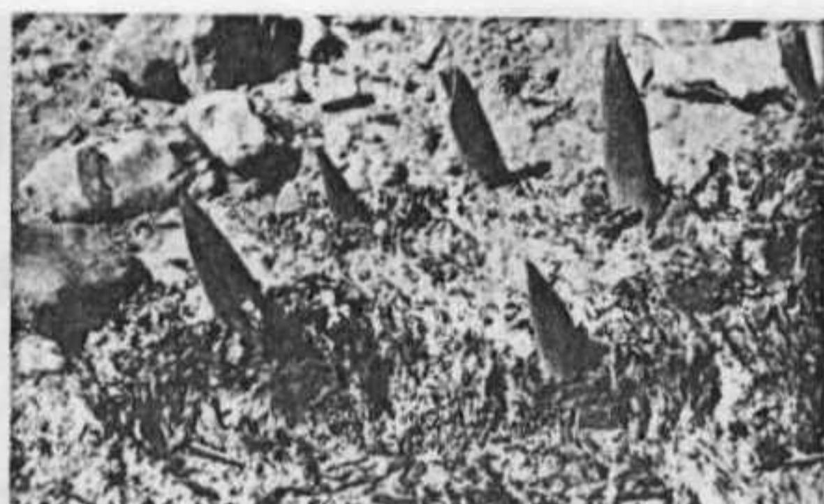
"יתדות" העלים פורצים בחודש נובמבר.