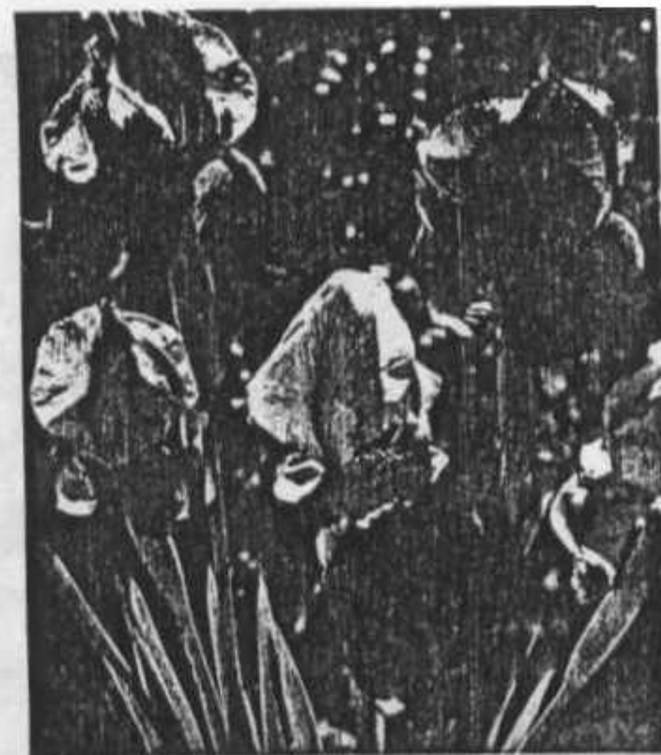
אירוסי כלאיים – זנים שפיתח דוד שחק בטירת צבי

שני בני-שיח יפים ושימושיים הגדלים רק בארץ, שייכים לסוג אזובית (Origanum) וגדלים בצמידות לסלעי גיר בהר הנגב, ניתנים לגידול בגינות גם בחלקים אחרים של הארץ. אנחנו הצלחנו לגדלו בגינתנו בירושלים. המדובר באזובית המדבר, הגדלה בצפון הנגב ובדרום מדבר יהודה ובאזובית הרמון, הגדלה בהר הנגב הגבוה. שני המינים גדלים בכיסי קרקע ובסדקי סלעים באזורים אלה. לשני המינים יש פרחים לבנים קטנים והפריחה קיימת במהלך כל חודשי השנה. מומלץ לשתול אותם בין סלעי גיר גדולים ולתת להם אפשרות להיקלט ללא השקייה מרובה. כדאי לבצע את השתילה בחורף ואם הצמחים יקלטו, הם לא יראו סימני קמילה בהגיע הקיץ, אלא רק יחליפו את עלי החורף הגדולים שלהם בעלי קיץ קטנים. במהלך